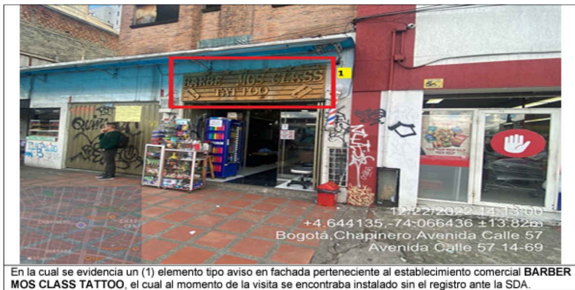
Fotografía No. 2